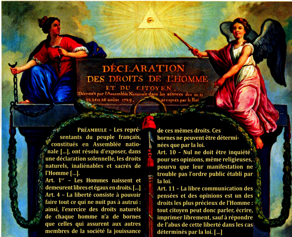
■ Peinture sur bois, musée Carnavalet, Paris. (Texte recomposé).