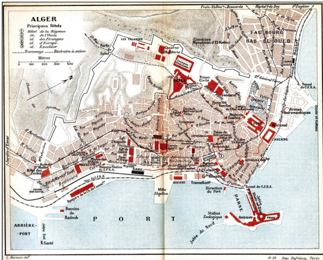
Document 1 : Plan d'Alger ; Guide Bleu Hachette 1911

2016/chapitre/1189016/conquetes-et-societes-coloniales/page/1189022/la-societe-coloniale-en-algerie-francaise/lecon