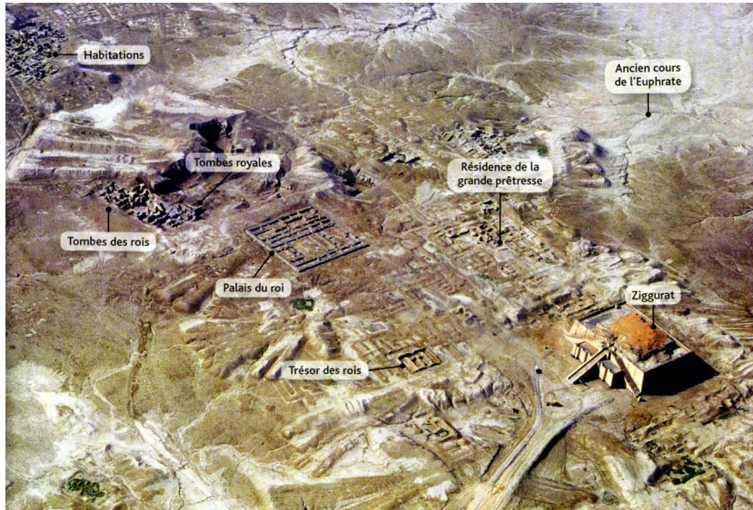
Document 4 : Les ruines de la cité d'Ur